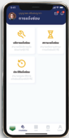
การแจ้งซ่อม