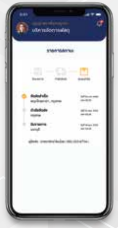
บริหารจัดการพัสดุ