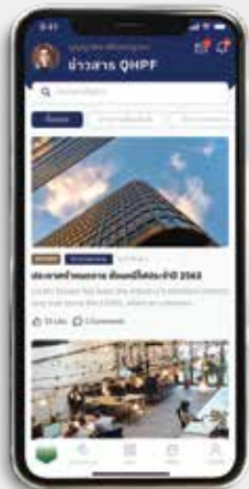
ประกาศข่าวสารภายในอาคาร